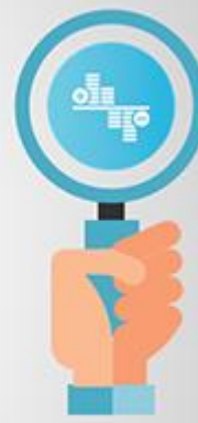
ترازنامه Balance sheet

خلاصه‌ای از درآمدها و هزینه‌های واحد تجاری است برای یک دوره زمانی معین