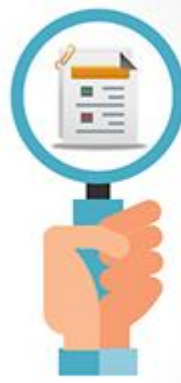
صورت سود و زیان Income statement

خلاصه‌ای از جریان‌های نقدی حاصل از عملیات، سرمایه‌گذاری و فعالیت‌های تأمین مالی در طول دوره زمانی مشخص