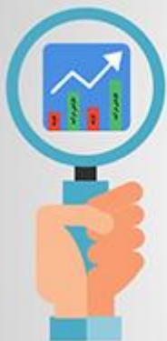
صورت سود و زیان جامع comprehensive income statement

گزارشی از تغییرات افزایشی یا کاهش‌ی ناشی از درآمدها یا هزینه‌ها (تحقق یافته یا نیاتنه) طی دوره مالی